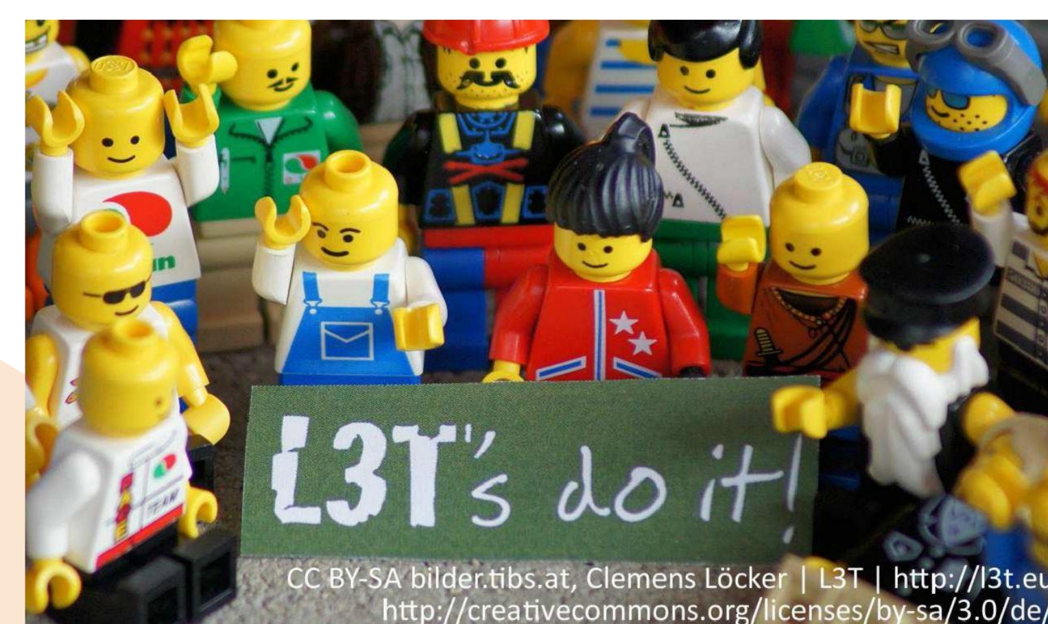
CC BY-SA Bilder: tibs.at, Clemens Löcker | L3T | http://l3t.eu http://creativecommons.org/licenses/by-sa/3.0/de/