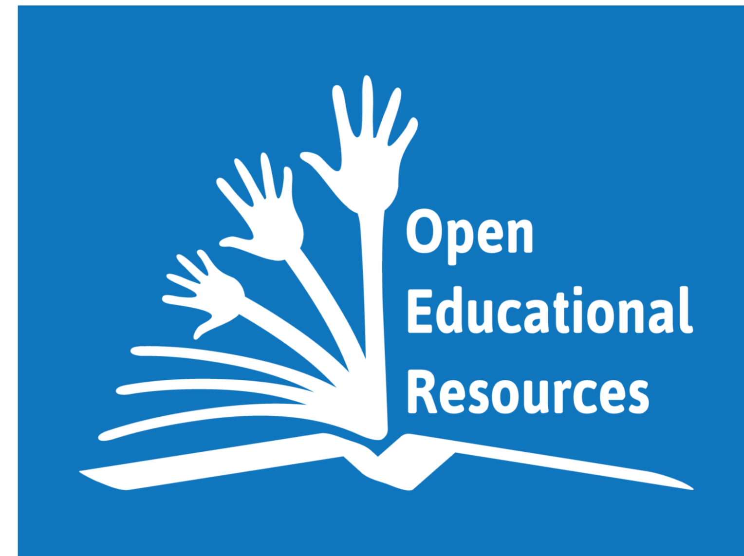
OER Global Logo by Jonathas Mello is licensed under a Creative Commons Attribution Unported 3.0 License

L3T, das „Lehrbuch für Lernen und Lehren mit Technologien“, ist in Deutschland eines der bekanntesten offenen Bildungsressourcen: l3t.eu